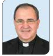
SANTOS MONTOYA TORRES OBISPO DE CALAHORRA Y LA CALZADA-LOGROÑO.

Quizá han visto pasar por las calles de Logroño un autobús con la campaña XTantos en la que aparece uno de los 15 participantes que no marcaban la casilla de la Iglesia, la famosa X en la declaración de la Renta. Como muchos contribuyentes, ya sea por desconfianza hacia la Iglesia, por no estar de acuerdo con el método, por cuestiones ideológicas, o por otros motivos, no estaban dispuestos a derivar el 0,7% de sus impuestos a financiar la labor de la Iglesia Católica, aun a sabiendas de que dicho porcentaje no se lo ahorran, ya que el Estado lo empleará en otros menesteres si el declarante no lo indica expresamente. Esta postura supone dos tercios de las declaraciones que se realizan cada año en España.